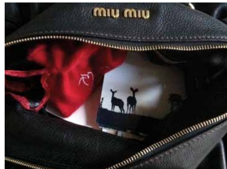
DAS «ALLERNOTWENDIGSTE» IN DER SCHATZTRUHE...