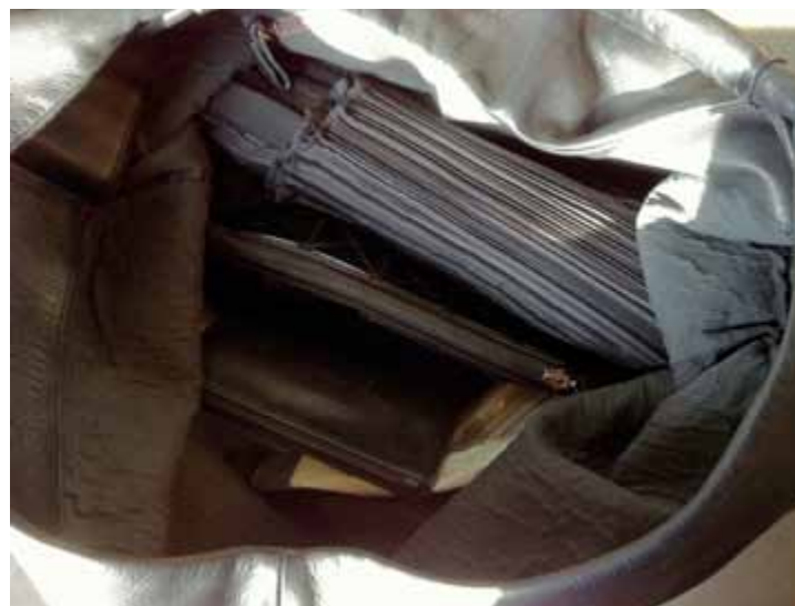
SINNLICHKEIT IN DER INNENWELT DER HANDTASCHEN